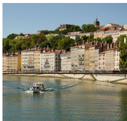
Lyon Saône

Tarifs : adhérent → 250 € / non-adhérent → 350 €