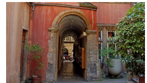
Vieux Lyon.jpg

20h00 Repas dans un restaurant du centre-ville de Lyon